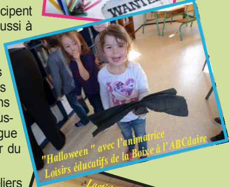
"Halloween" avec l'animatrice Loisirs éducatifs de la Boixe à l'ABClaire