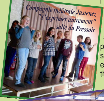
Compagnie théâtrale Justenez "S'exprimer autrement" salle du Pressoir