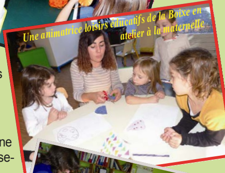
Une animatrice loisirs éducatifs de la Boixe en atelier à la maternelle