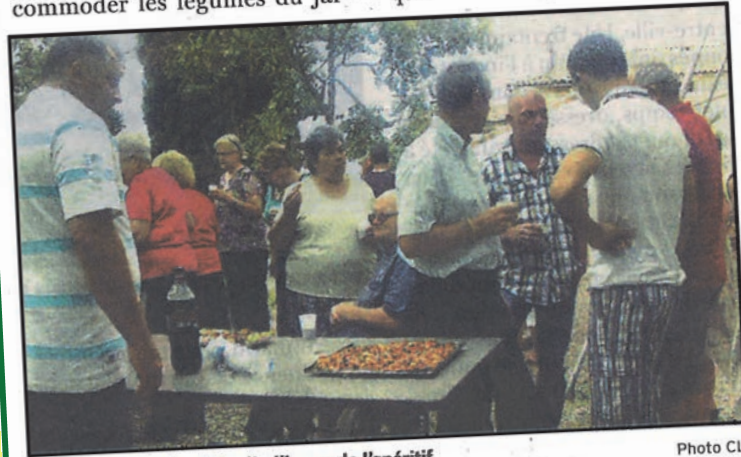
L'ombre était recherchée dès l'heure de l'apéritif.

din. Cette année, les entrecôtes ont été cuites sur la braise, donnant à ce repas un relief de fête fort apprécié. Les jeux de boules, de Mòlky et les balades ont permis de continuer les conversations entre voisins avant d'achever la journée autour de bonnes quiches et autres tartes.