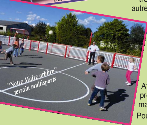
"Notre Maire arbitre" terrain multisports