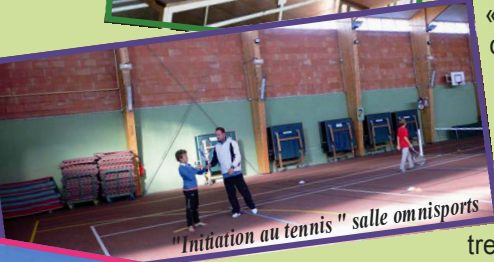
"Initiation au tennis" salle omnisports