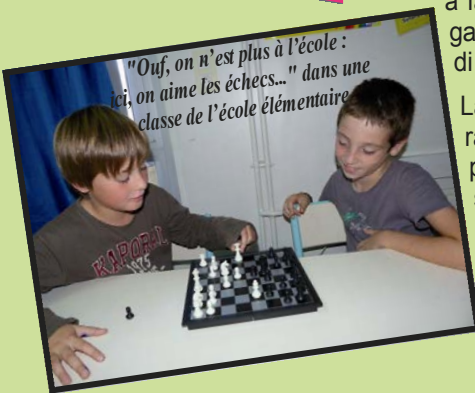
"Ouf, on n'est plus à l'école : ici, on aime les échecs..." dans une classe de l'école élémentaire