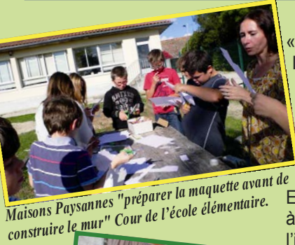
Maisons Paysannes "préparer la maquette avant de construire le mur" Cour de l'école élémentaire.