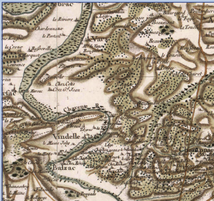
Carte de Cassini canton Vars

Le district d'Angoulême est donc «borné au nord par les paroisses de St-Genis (d'Hiersac), de Chebrac, Vars et Chaniers (Champniers)» (1)